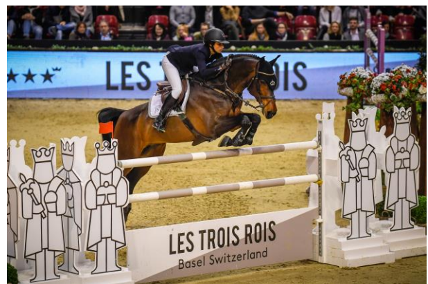
Der Sprung des Grand Hotel Les Trois Rois

Zum zehnjährigen Jubiläum des LONGINES CSI in Basel hat die Fédération Equestre Internationale (FEI) diesen Springreiter-Concours neu als Weltcupspringen klassifiziert. Das Grand Hotel Les Trois Rois fiebert deshalb nach dem Jahreswechsel dieser Gala des Pferdesports umso mehr entgegen – denn hier trifft sich die Weltelite der Springreiter zu einem unvergesslichen Turnier. Der internationale Anlass ist einer der weltweit höchstdotierten Hallen-Grand-Prix mit einer ganz besonderen Ambiance. Das Grand Hotel freut sich auf anspruchsvolle Parcours und spannende Wettkämpfe auf höchstem Niveau und ist stolz, den Preis des Grand Hotel Les Trois Rois zu stiften.